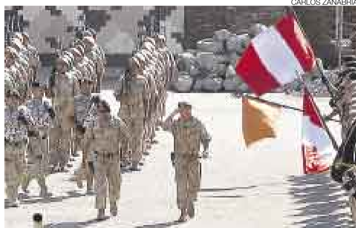
ADIÓS MI GENERAL. El fuerte Bolognesi, sede del cuartel general de la Región Militar del Sur, fue escenario de la despedida al general Donayre.

“(Donayre) se irá el día de su retiro: el 5 de diciembre. El Perú tampoco puede decidir sacar a un general porque se lo pide un