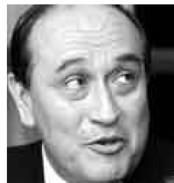
MANTILLA. “Años que no lo veo”.

Por eso voy a tener mi consejo consultivo, para ser transparentes. Además, trabajaremos de la mano de la contraloría. Soy la