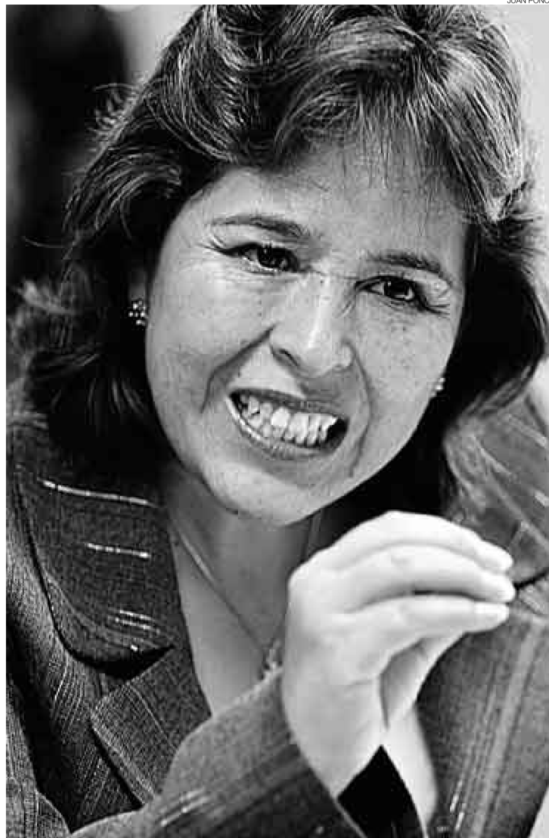
DA SU PALABRA. La flamante ministra de Vivienda y Construcción rechaza que su gestión permita el ingreso de militantes apristas al sector. “Por sus frutos los conoceréis, déjenme trabajar y se juzgarán los resultados”.

1.140 millones de soles. El 94% se destinó a inversión. Para el 2009 tendremos 1.241 millones. La ventaja es que contamos con el Foniprel, que cofinanciará salud, educación y también vivienda. Es otra de las alternativas que tienen nuestros alcaldes, en febrero sale la convocatoria. Concentraremos nuestra atención en los proyectos del 2006 que están atracados y que tienen problemas de arbitraje. Esto no ha sido manejado directamente por el ministerio sino por los gobiernos regionales. Vamos a afianzar más a los supervisores de Agua para Todos en cada una de las regiones. La dificultad es la falta de asesoramiento técnico, aspiramos tener un asesor en cada región. Vamos a concentrar los proyectos en la sierra y en la selva. También, esperamos que