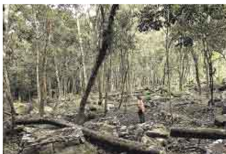
AVISADOS. El Tratado de Libre Comercio con Estados Unidos impone condiciones para mejorar la fiscalización del tráfico ilegal de madera.

Sin embargo, de este total de denuncias el 73%, es decir 492 procesos, corresponde a tráfico ilegal de madera.