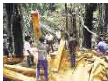
FALTA INDUSTRIA. La madera se exporta sin valor agregado.

dólares es lo que se exportó en madera aserrada durante el 2007. Otros 100 millones correspondieron a triplay, muebles y tablillas frisos para parquet.