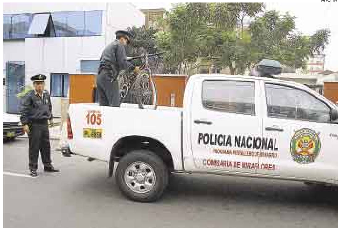
SE QUEDA. El programa Patrullero de mi Barrio es uno de los que, por el momento, no será modificado.

Como se sabe, el titular del Interior informó que se crearán 28 jefaturas con personal y logística para hacer investigación delictiva. ¿Pero qué tan diferente será en la práctica esta nueva organización? De acuerdo con información brindada por coroneles PNP, en el organigrama actual de la policía ya existen jefaturas distritales que están al mando de tres o cuatro comisarías. Estas agrupan a las principales unidades de la policía (Tránsito, Escuadrón de Emergencia, Seguridad Ciudadana, etc.) para que el ciudadano tenga acceso a ellas.