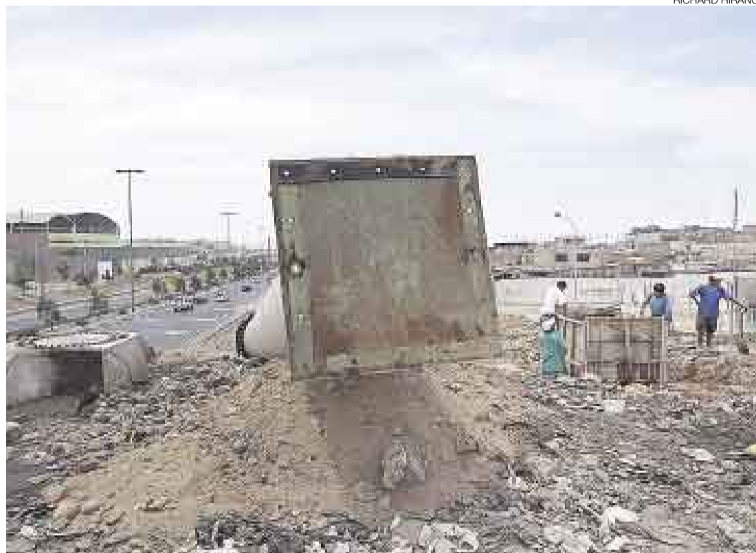
SE ACOMODAN. La empresa Punto Visual cambió ayer de lugar uno de sus paneles en la Panamericana Sur.