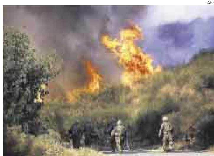
GUERRA. En agosto se produjo un conflicto en el Cáucaso que mostró el poderío de Rusia dirigida por la dupla Medvedev-Putin.