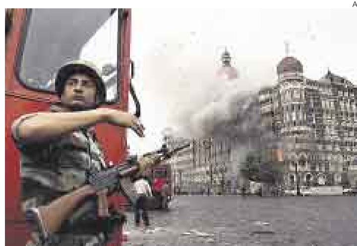
DOLOR. Los atentados de noviembre cometidos contra hoteles de Bombay han enfrentado a los gobiernos de India y Pakistán.

dias. Desde el primer mes del calendario, la peores tormentas de invierno en medio siglo afectaron a 21 regiones, cobraron 129 vidas y dejaron a 1'660.000 personas sin vivienda. Las pérdidas económicas ascendieron a 21.110