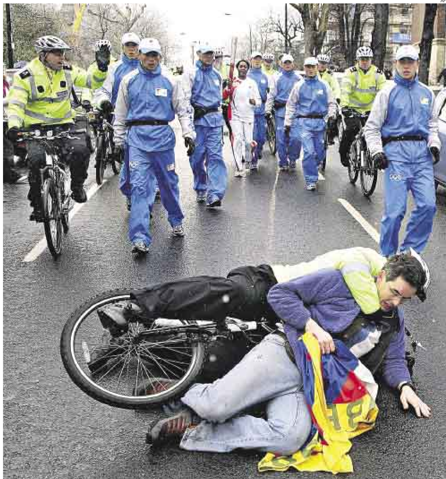
PROTESTA. Las Olimpiadas de Beijing pusieron a China en el ojo público y provocaron actos como los que hubo a favor del Tíbet en todo el mundo.

China fue el centro de gravedad de Asia en el 2008. El año de los Juegos Olímpicos de Beijing estuvo lleno de triunfos y trage-