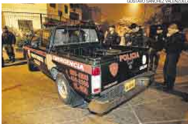
A QUEMARROPA. Delincuentes usaron armas automáticas en el Callao.

Un policía murió de un balazo en la cabeza y otro resultó gravemente herido la madrugada de ayer en el Callao cuando iban a intervenir un automóvil sospechoso. Los agentes no sabían que en el interior tres sujetos mantenían cautivo al gerente de una firma de alimentos, quien al final logró escapar ileso, aprovechando la confusión por los disparos. [A8]