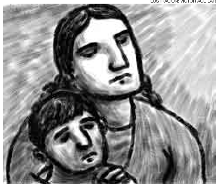
ILUSTRACIÓN: VÍCTOR AGUILAR

Seré nacionalista moderado, rechazando el abuso de banderas antichilenas o cualquier otro chantaje emocional patriótico. Me sumaré a campañas de defensa del consumidor, de acceso a la información, saludaré éxitos y arrepentimientos sinceros. Espero que me ayuden a cumplir con esta agenda. ■