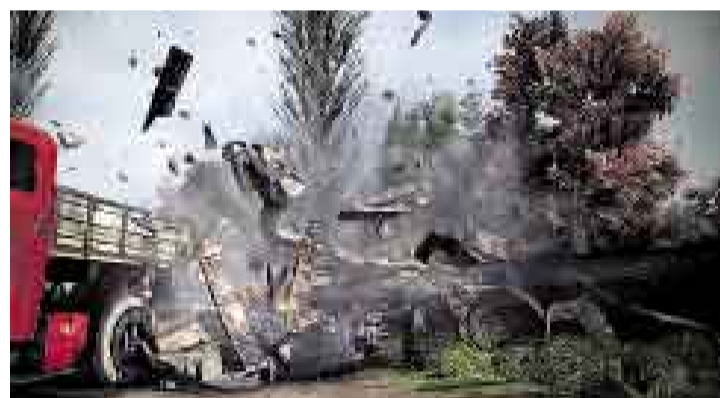
ATRACCIÓN. El juego ofrece acciones bélicas en diversos escenarios.

Es muy probable que al principio uno pierda la paciencia por la cantidad de veces que se muere y por no poder controlar al escuadrón. Pero no se complique. La principal diferencia de este juego con otros de su tipo es la