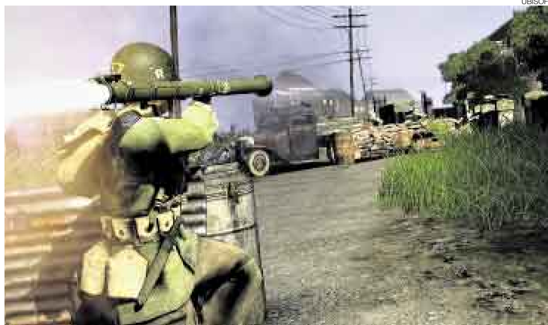
IMPACTO. El realismo que se aprecia en el videojuego fue reconocido en un especial por The History Channel.

Ha sido lanzado para las consolas de Xbox 360, PlayStation 3 y PC. También existe una versión para móvil en el portal N-Gage de Nokia.