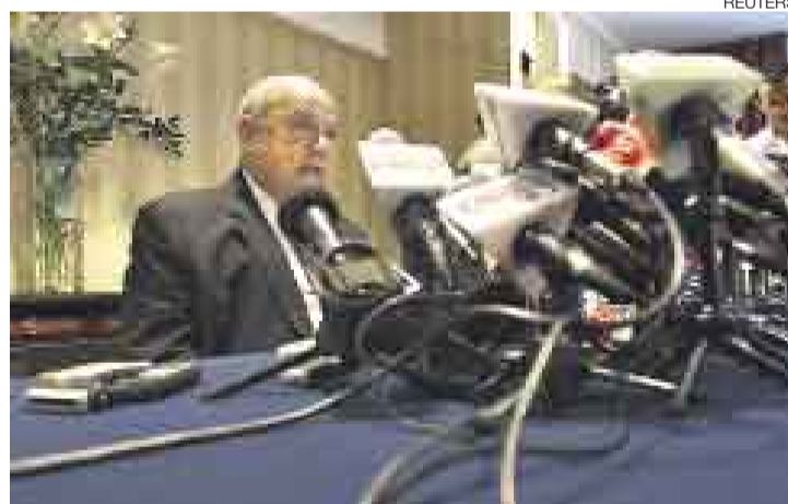
NO SE PRESENTA. José Miguel Insulza puso fin a las especulaciones.

Insulza, cuya presencia en Chile se esperaba todavía para mañana miércoles, adelantó su viaje a Santiago para dar a conocer su decisión. “Mi presencia en el país el día de hoy (ayer) tiene por objeto solicitar a los partidos de la Concertación que mi nombre no sea considerado en la definición presidencial del 2009”, señaló a la prensa.