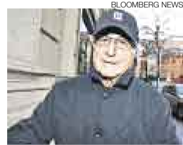
ACUSADO. Bernard Madoff.