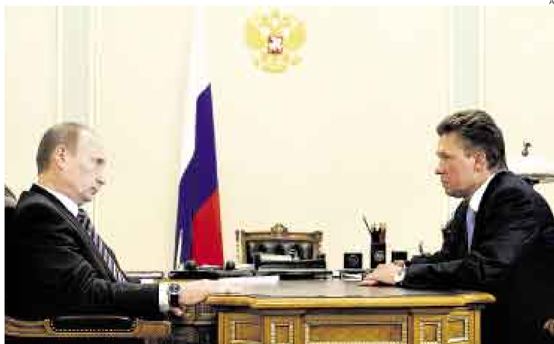
COMPÁS DE ESPERA. La Unión Europea aboga para que Rusia y Ucrania respeten los contratos vigentes.

Sin ánimo de encontrar la solución para lo que considera un