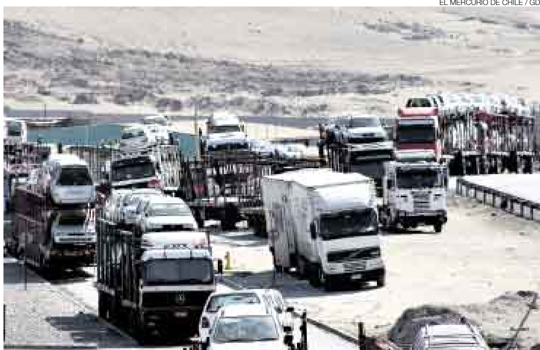
NADIE PASA. Unos 230 camiones, que transportan mil autos usados desde la zona franca de Iquique hasta La Paz, están varados en el paso fronterizo de Tambo Quemado. Muchos pasaron allí la Navidad y el Año Nuevo.

Hace tres semanas, los importadores adoptaron una medida similar, la cual fue desarticulada por la policía. En ese altercado falleció un mecánico.