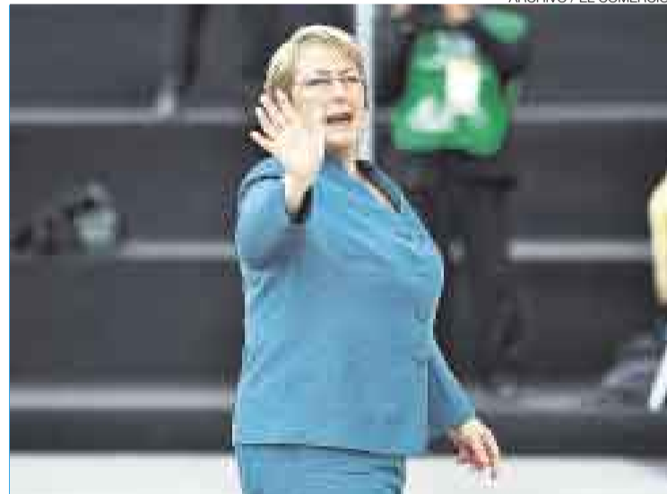
PREOCUPADA POR CRECIMIENTO. La mandataria chilena, Michelle Bachelet, calificó el paquete de potente e innovador.