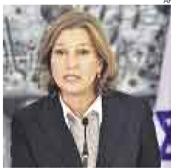
TZIPI LIVNI. Canciller israelí.

JERUSALÉN [EL COMERCIO/AGENCIAS]. La ministra israelí de Relaciones Exteriores, Tzipi Livni, rechazó ayer la propuesta que le hicieron llegar los diplomáticos europeos sobre un alto el fuego inmediato en Gaza y afirmó que Israel está determinado a "cambiar la situación en la región". "Luchamos contra el terrorismo y no firmaremos ningún acuerdo con el