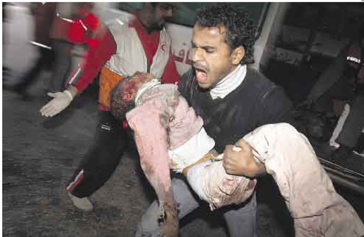
DESCONSUELO. Más de cincuenta palestinos, incluidos unos 12 niños, murieron en los ataques israelíes de ayer contra Gaza.

Pero ahora la belleza del sitio —que puede ser el lugar soñado de una casa de campo con vista al mar— se contradice con la tensión del momento. No cesan de escucharse los ruidos de los aviones y helicópteros que asoman, miden y lanzan cohetes o misiles sobre la franja de Gaza. Son los sonidos de la guerra y pienso en cuánta gen-