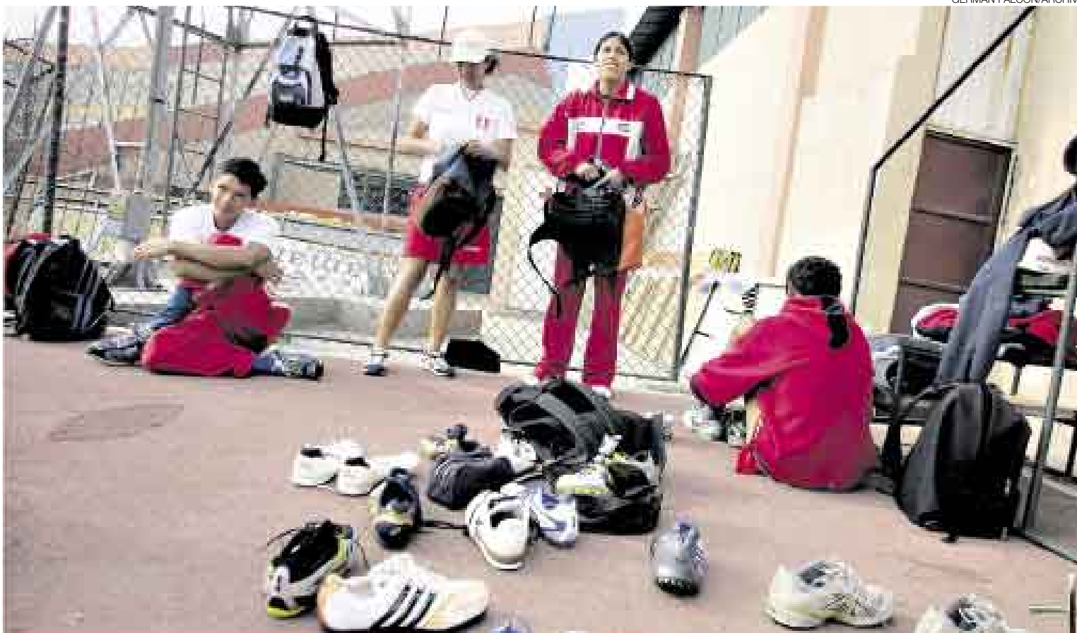
BUEN PEDAZO. El atletismo fue una de las disciplinas deportivas que más recibió de la torta repartida por el IPD. Igual, su panorama es complicado.