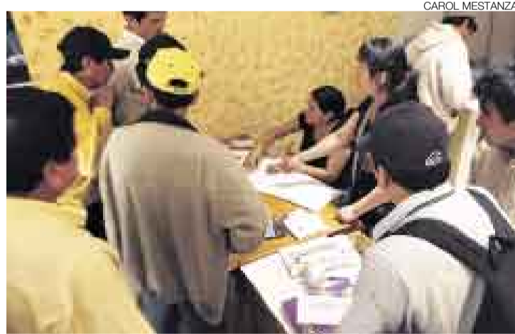
A DAR EXPLICACIONES. La empresa Dr. Óptimo Serrano sigue vendiendo pasajes y su propietario se encontraría en el lugar del accidente.

La unidad de la empresa de transportes Dr. Óptimo Serrano