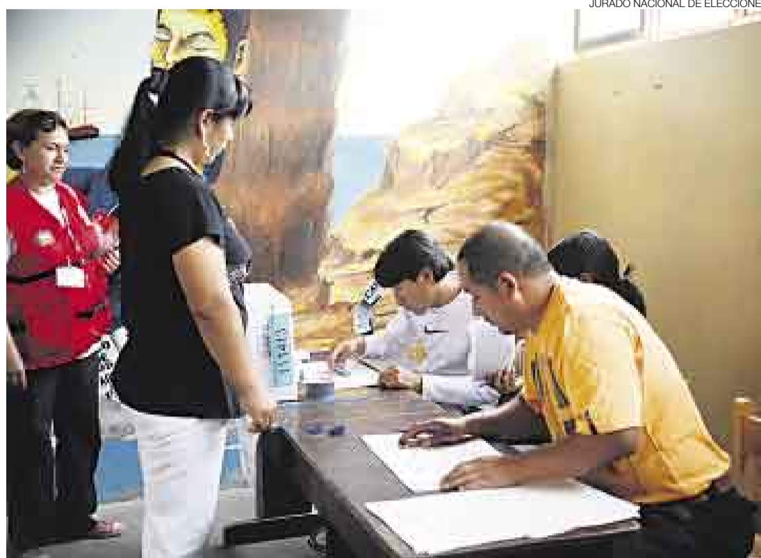
PROCESO EN ORDEN. Los electores de Curimaná y Paracas emitieron ayer su voto de manera cívica, por lo que no hubo mayores sobresaltos. La consulta de revocatorias concluyó a las 4 de la tarde.

El miembro del JNE felicitó la conducta cívica de los electores de Curimaná y Paracas, pues la