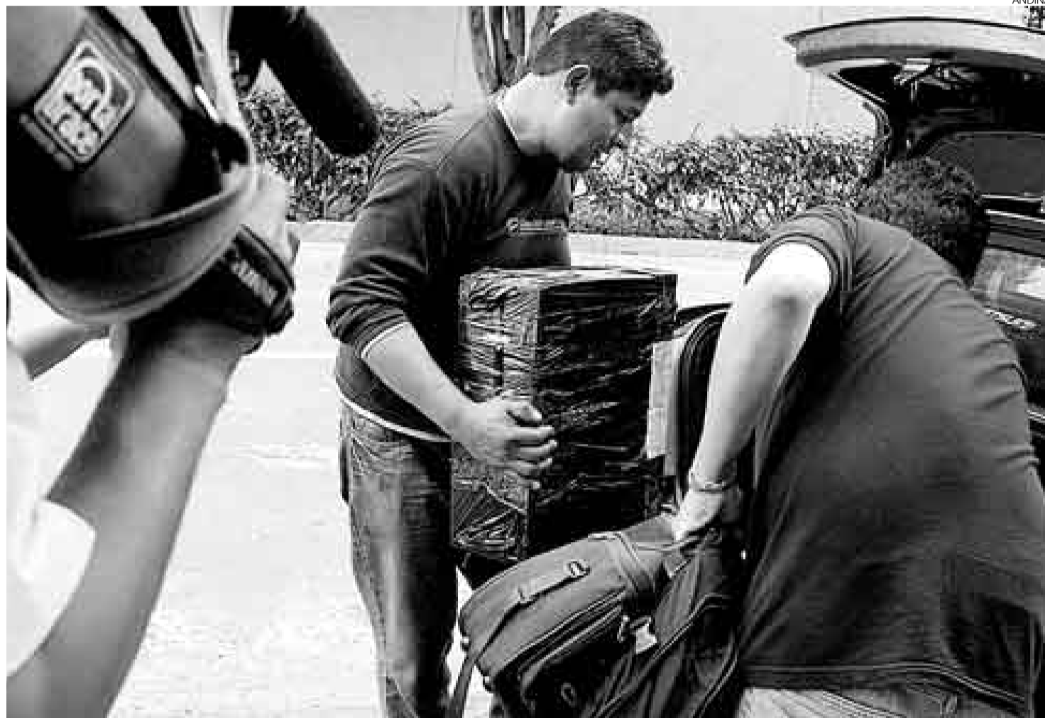
HAN SIDO LACRADAS. Las memorias de las 25 computadoras incautadas el pasado jueves 8 serán abiertas solo si sus propietarios son acusados.

Además del local de Business Track, en la avenida Salaverry 2007 (Lince), se intervinieron los domicilios de los investigados en las calles Los Cedros 250 (Surco), Teniente Romanett 132 (San Isidro), en la manzana AZ, lote 11 de la urbanización Coviotimar (Santa Rosa), avenida Perú 3239 (San Martín de Porres),