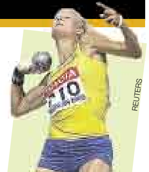
Carolina Klüft Campeona olímpica

Cuatro meses después de ganar 8 medallas olímpicas de oro en Beijing, el nadador está listo para volver a entrenar, con algunos dolores pero ansioso por borrar cualquier idea de un posible retiro.