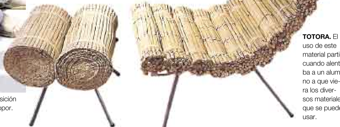
TOTORA. El uso de este material partió cuando alientaba a un alumno a que viera los diversos materiales que se pueden usar.