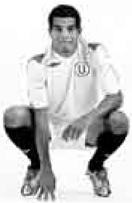
LISTO. El 'Zorrito' volvió (por fin) a su primer club.

"Fue una negociación muy larga, pero ya puedo