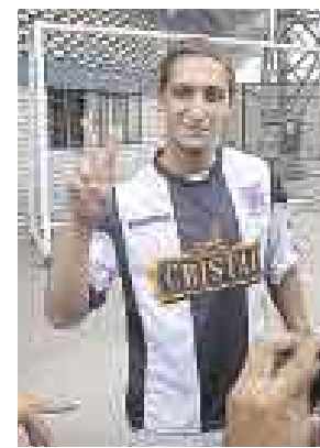
CARTA. Hizo más de 100 goles en inferiores.