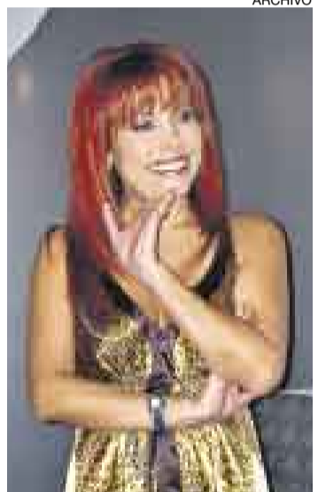
AL AIRE. La 'Urraca' conducirá su programa radial al mediodía y tocará temas de ayuda social.

La polémica conductora de TV Magaly Medina volverá a emitir su espacio radial a partir de marzo, reveló Jesús Miguel Calderón, gerente de Radio Capital.