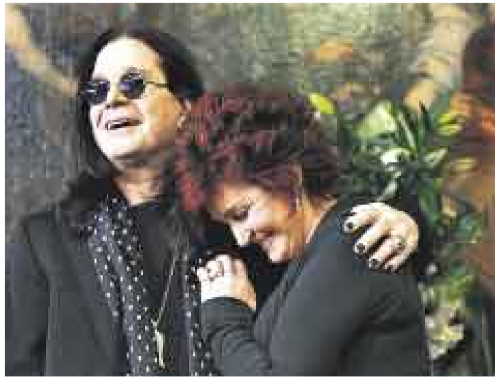
PECULIAR. Ozzy Osbourne y su esposa, Sharon, harán de las suyas.

bourne recargados") presentará a Sharon, Ozzy y a sus hijos Jack y Kelly en rutinas del estilo de cámara oculta. Contará, además, con la participación especial de personajes como Pamela Anderson.