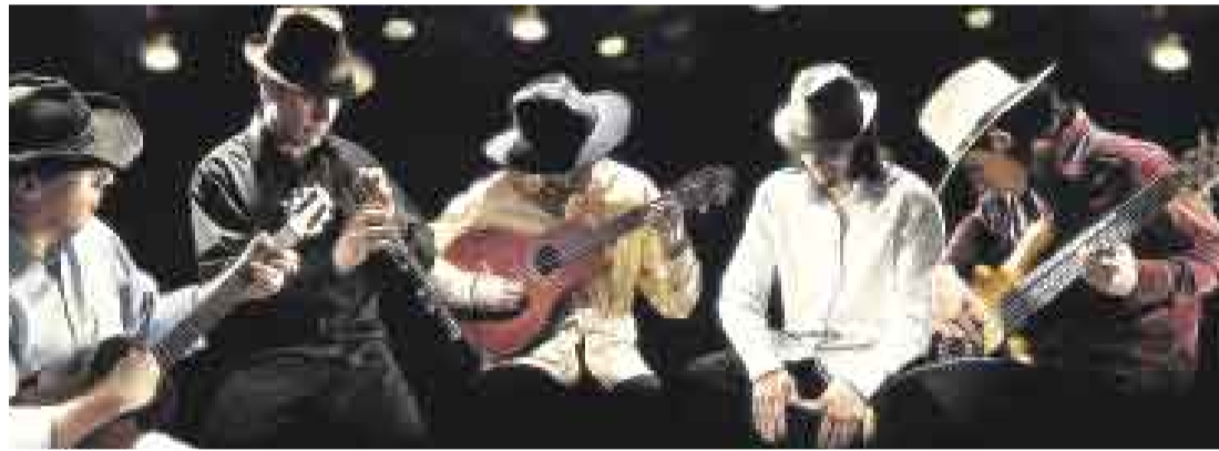
ESTILO. La música de los Llanos estuvo presente a través del Ensamble Sinsonte. Junto con Stephen Prutsman trabajaron un proyecto para fundir expresiones populares con tendencias académicas.

★ DVORÁK, SCHUMANN, BEETHOVEN Y OTROS GRANDES MAESTROS REUNIDOS EN EL CARIBE ★ ES LA OBRA DE UNA FUNDACIÓN CON METAS MUY CLARAS SOBRE EL ALTO NIVEL MUSICAL QUE SE EXIGE A SÍ MISMA Y UN PROGRAMA SOCIAL QUE CONTRIBUYE A LA FORMACIÓN DE LAS NUEVAS GENERACIONES