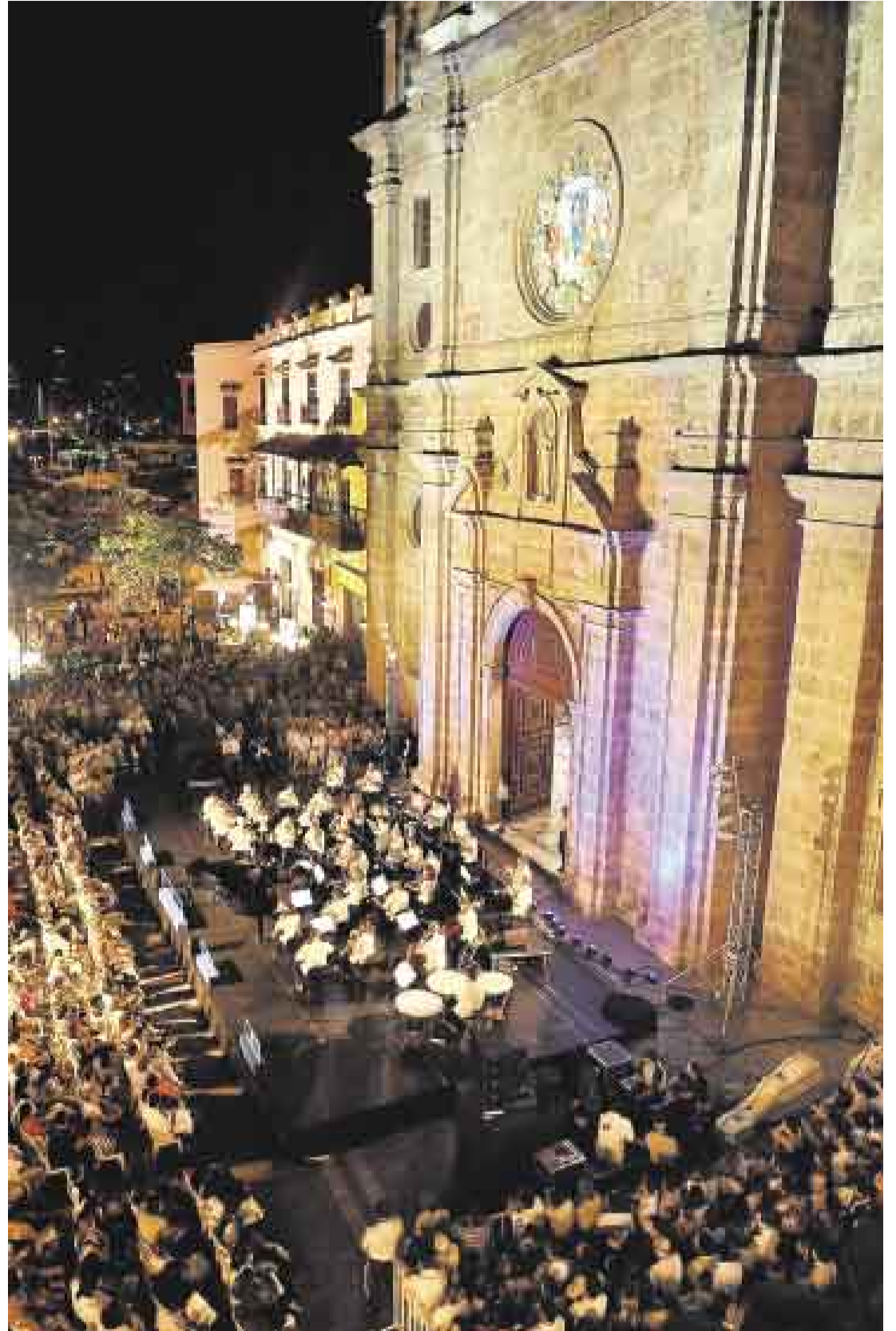
PARA TODOS. En la fachada de la iglesia de San Pedro Claver se ofrecieron conciertos gratuitos durante las noches.