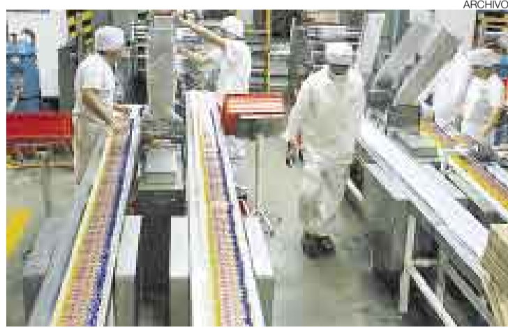
IMPACTO. Las salvaguardias impuestas por Correa afectarían a empresas peruanas de los sectores alimentos, textil, bebidas, calzado, etc.

Alentado por una fuerte caída de su balanza comercial, el presidente Correa decidió a inicios de enero prohibir las importaciones de más de 325 subpartidas, entre ellas las que provienen del Perú.