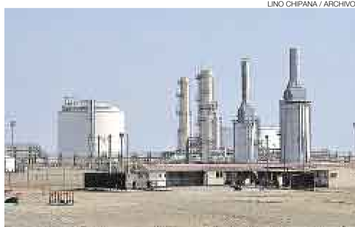
ESCASEZ ENERGÉTICA. La planta Malvinas en Camisea ya no tendría capacidad para atender una mayor demanda, según el Osinermin.